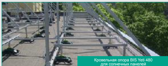
Кровельная опора BIS Yeti 480 для солнечных панелей