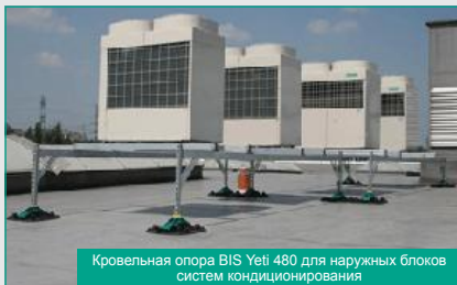
Кровельная опора BIS Yeti 480 для наружных блоков систем кондиционирования

Система BIS Yeti главным образом используется с: