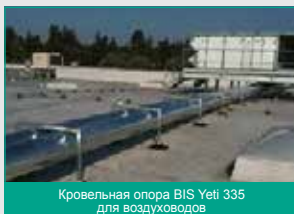
Кровельная опора BIS Yeti 335 для воздуховодов