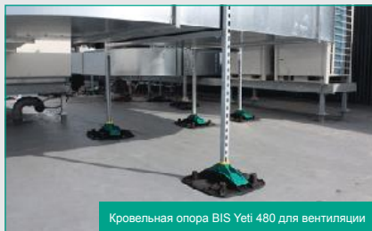
Кровельная опора BIS Yeti 480 для вентиляции

Walraven предлагает много решений для поддерживающих и опорных конструкций на плоских кровлях. Кровельные опоры BIS Yeti - это модульная система, которая позволяет монтировать разного рода конструкции на плоских кровлях, и даже кровлях с небольшим уклоном!